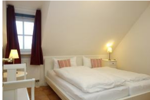
Das Elternschlafzimmer mit Doppelbett 180x200cm