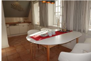
...hier noch einmal der Esstisch.