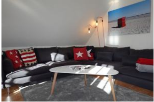
...machen Sie es sich gemütlich.