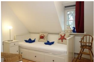
Das zweite Schlafzimmer mit Einzelbett 80x200cm