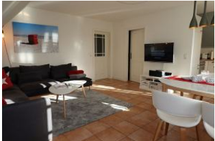
Couch und TV Gerät.