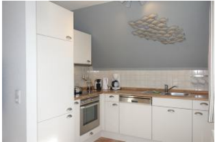
Die offene Einbauküche