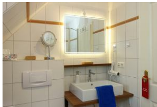
Das Duschbad mit Handwaschbecken. (nicht im Bild die Toilette)