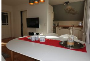
...der Tisch ist schon fast gedeckt, im Hintergrund die Küche.