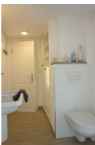
...Toilette und Einbauschränk