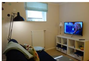
...TV Gerät und DVD Player