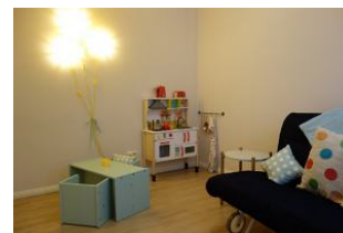
...und für unsere kleinen Gäste ein Tisch mit Stühlen und eine Spielküche