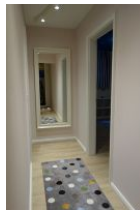
Der Flur führt rechts ins Schlafzimmer, links ins Spielzimmer