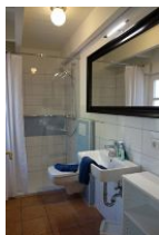
Das Duschbad im Erdgeschoß