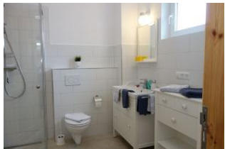
..das neue Bad mit genügend Abstellfläche und ...