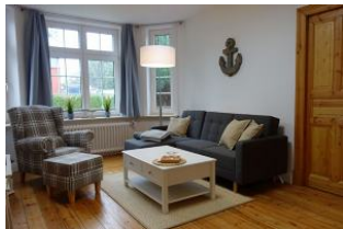
...ein großes, gemütliches Sofa und ein Ohrensessel für den gemütlichen Abend...