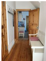
...treten Sie ein...