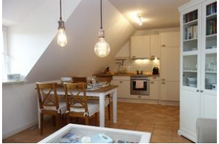
Der Blick zum Esstisch und der Küche, von der Couch aus.