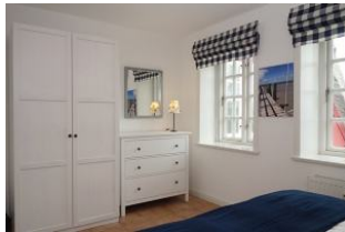
Schrank und Kommode für die Kofferinhalte