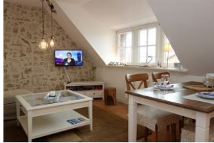
Großes TV Gerät für gemütliche Fernsehabende