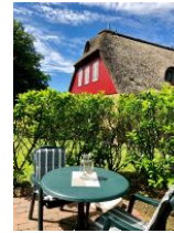
...Tisch und Stühlen.