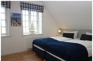
Das Schlafzimmer mit Boxspringbetten, je 90x200cm