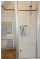
Die Duschkabine und Handtuchheizung