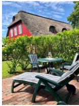
Im großen Garten ein kleines Plätzchen nur für die Wohnung 5 mit Liege und...