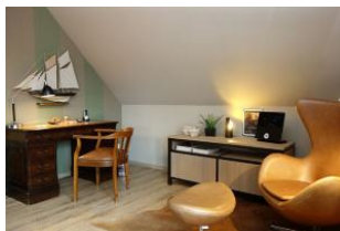
Der linke Teil des Wohnzimmers mit antikem Schreibtisch und "Ohrensessel" ...