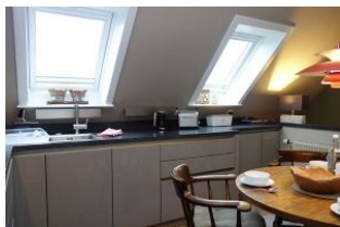
...Platz für die Vorbereitungen.