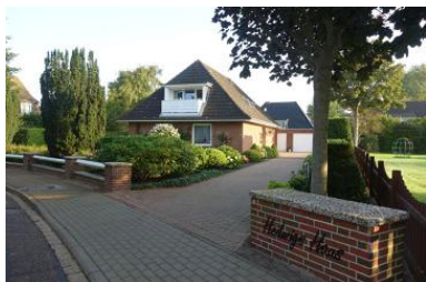
Hedwigs Haus in der Flurstr. 5