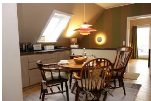
Die Wohnküche, wer hier einmal sitzt, steht nur schwer wieder auf...

Diese geräumige OG-Wohnung für 4 Personen hat Stil. Allein der gemütliche Essplatz in der modernen Küche, das zweigeteilte Wohnzimmer, ein Bereich zum Lesen, ein Bereich zum TV schauen. Die Schlafzimmer und das Bad auf der anderen Seite der Wohnung. Hier stört niemand den Anderen. Ein Garderobenraum mit genügend Platz für Jacken und Schuhe und ein Hauswirtschaftsraum runden den Komfort ab. Es wird Ihnen an nichts fehlen, versprochen .....und noch eine Überraschung: am Strand steht ein Strandkorb zur kostenlosen Nutzung für Sie bereit.