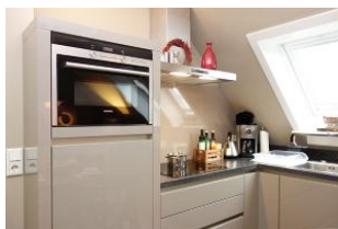
Moderne Einbauküche mit allem, was man so zum kochen braucht, vor allem....