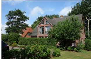
Haus Neshörn in Wyk im Sommer

Das Haus Neshörn ist zu erreichen über die Strasse "Am Leuchtturm" Hausno.4 liegt gemeinschaftlich mit der "Strandvilla" auf einem großen Grundstück der Familie Buchner/Petersen. Wir bieten Ihnen mit der Whg.2 (Atlantis) im EG eine große Wohnung für den Familienurlaub. Die unmittelbare Lage zum Strand und der damit verbundenen salzigen Seeluft macht hungrig und müde. Da ist es schon sehr erholsam, wenn man nur ein paar Schritte nach Haus gehen muss.