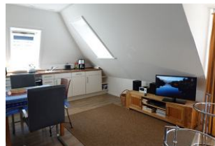
Das TV Gerät