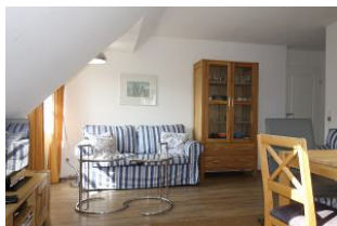
...mit gemütlicher Couch...