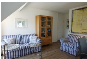
Couch und Sessel, beides sehr gemütlich, auch für einen langen TV-Abend geeignet.