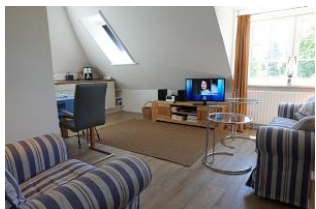
....treten Sie ein in diese "schnuckelige" Wohnung

Zauberhafte, helle Wohnung im 1.OG eines Zwei-Familienhauses. Im Juni 2011 komplett renoviert und mit viel Liebe zum Detail eingerichtet. Das Wohnzimmer mit offener Küchenzeile (sehr kommunikativ !), das Schlafzimmer mit zwei Einzelbetten, großem Einbauschränk und nicht zuletzt das neue Bad mit flacher Duschwanne für den bequemen Einstieg. Zudem wartet im Garten ein herrliches Plätzchen auf Sie....Lassen Sie es sich gut gehen und genießen Sie die Atmosphäre.