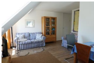
...und nehmen Sie platz für geruhsame Stunden.