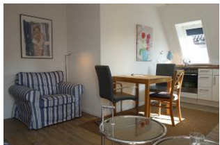
...großer Sessel, passend zur Couch.