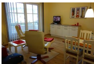
Zwei Relaxstuhl zum Fernsehen, entspannen, lesen ....