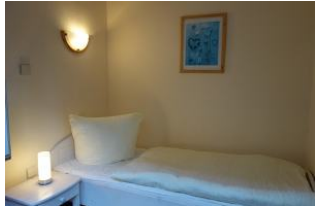
... ein klitzekleines Schlafzimmer mit Einzelbett