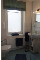
Das Duschbad mit Handwaschbecken, Toilette und ....