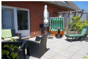
Die herrliche Dachterrasse mit Strandkorb und Lounge - Möbeln - im Sommer ein Traum !