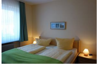
Das Schlafzimmer mit großem Doppelbett...