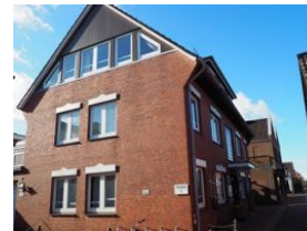
Ansicht Haus Teunis Carl-Häberlin-Str.