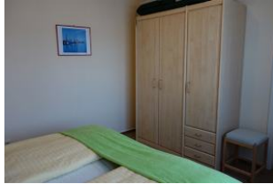
...und auch für genügend Stauraum ist gesorgt. Vom Schlafzimmer aus geht man in.....