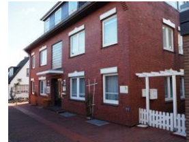
Ansicht Haus Teunis Mühlenstr.