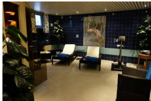
Der Fitnessbereich im Untergeschoß mit ...