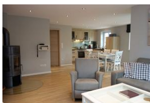
Der gemütliche Sitzbereich mit Blick zum Esstisch und zur Küche.