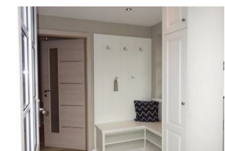
...selbstverständlich mit Garderobe, unter der Bank finden Schuhe ihren Platz.