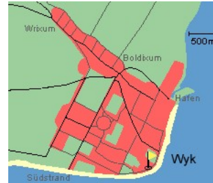
Entfernungen, zirka: zum Bäcker 700 m, zur Einkaufsmöglichkeit 900 m, zum Flugplatz 2,7 km, zum Golfplatz 2,8 km, zum Hafen 1,8 km, zum Meer 50 m, zum ÖPNV 400 m, zum Badstrand 50 m, zum Ortszentrum 1,0 km