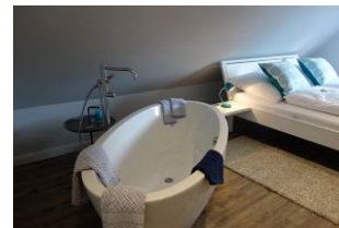
...drei Schritte zum Bett. Herrlich !