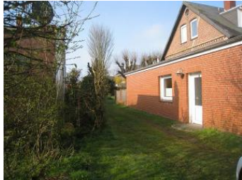
Die Eingangstür der Wohnung 5 der Ferienhäuser Carstensen