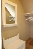
Ein Garderobenraum mit viel Platz für Jacken und Schuhe