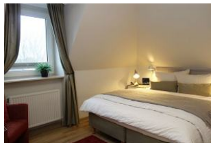
Das Elternschlafzimmer mit Doppelbett 160x200cm, ohne Fussteil