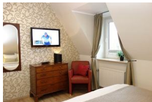
...Kommode, Spiegel und zweitem TV Gerät.