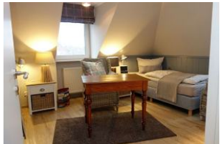
Das Kinderzimmer mit 2 Einzelbetten und Tisch