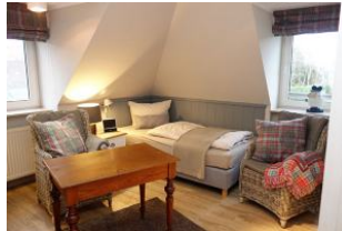
...und noch einmal das Ganze..