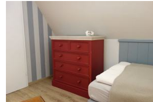
zus. zum Schrank noch eine große Kommode.