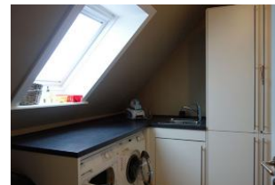
...last not least.... der Hauswirtschaftsraum. Unentbehrlich!