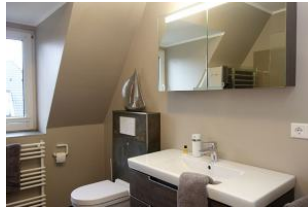
Das moderne Bad mit großem Waschtisch..