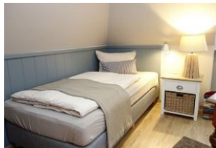
...links ein Bett...