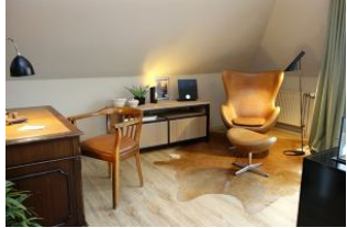
...für die Entspannung mit Musik und einem guten Buch? Rechts vom Sessel befindet sich die Balkontür.