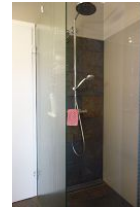
...und bodengleicher Dusche