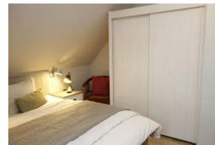
...und großem Kleiderschrank...