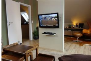
Der andere Teil des Wohnzimmers für die Fernsehstunde...