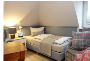
...rechts ein Bett...