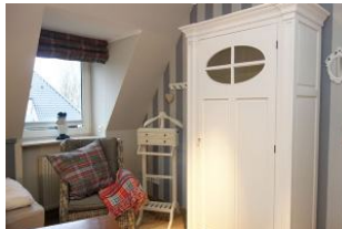
Der Schrank für die Kofferinhalte