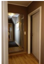
Der Flur zum Schlafzimmertrakt mit großem Spiegel...