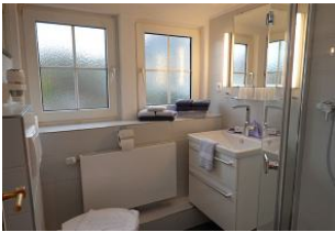
Das Badezimmer mit Waschbecken, Dusche und Toilette....