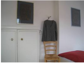
Der Schrank bietet genügend Stauraum