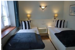
Das Schlafzimmer mit zwei fest eingebauten Einzelbetten