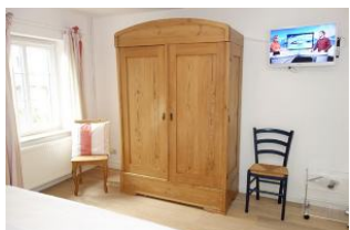
Viel Platz für Kofferinhalte und zweites TV Gerät