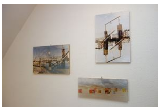
Bilder im Flur im OG