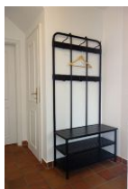
Die Garderobe im Flur.

Hier stellen wir Ihnen die linke Doppelhaushälfte des Hauses Adebar in Oevenum vor. Geschmackvoll eingerichtet bietet sie 4 Pers. ausreichend Platz für einen erholsamen Urlaub. Für Besuch stehen zwei weitere Schlafplätze zur Verfügung. Im Erdgeschoss befinden sich Wohn/Ess- und Küchenbereich sowie das Gäste - WC. Im Obergeschoss 2 Schlafzimmer sowie das große Bad mit Dusche und Badewanne. Genießen Sie die Ruhe des kleinen Inseldorfes Oevenum mit 600 Einwohnern, einem Bäcker, einem Einkaufsladen sowie dem Dorfkug der hervorragende Hausmannskost anbietet.