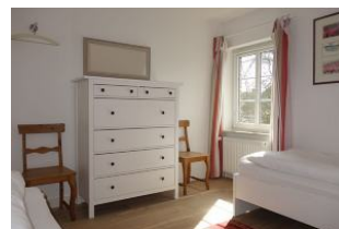
Kommode im Kinderzimmer