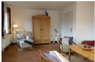
Die Lesecke und ein alter Bauernschrank für dütt und dat.