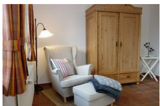
Hier noch einmal der Sessel, sooo gemütlich!