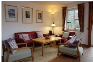
Couch und Sessel aus der Nähe.