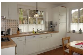
...Waschmaschine, befindet sich im Schrank neben dem Kühlschrank