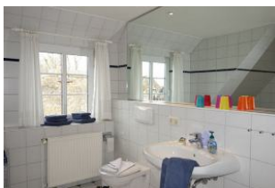
...mit großem Fenster ...