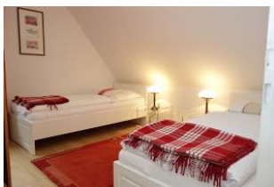
Zwei Einzelbetten im Kinderzimmer