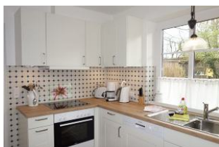
Die helle Küche mit großzügiger Küchenzeile. Geschirrspüler, Backofen und ...