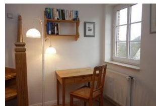
Ein kleiner Schreibplatz im Flur im OG für die ganz Fleißigen