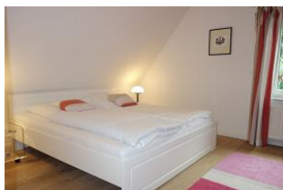
Grosses Bett im Elternschlafzimmer 180x200cm ohne Fussteil