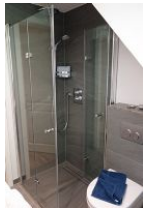
...und Duschkabine, aus Echtglas, sehr bequem: die Glaswand ist komplett weg zu klappen.