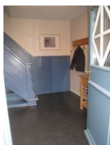
Der Flur und Eingangsbereich der Whg. 1 - Picasso

Das Malerhaus wurde lange Zeit durch die Familie Böhmg vermietet, die auch für das Gästehaus Rothtraut verantwortlich zeichnete. Wir freuen uns sehr, Ihnen jetzt drei renovierte Wohnungen anbieten zu können. Die Wohnung Picasso bietet ausreichend Platz für 6 Personen. Im EG, gleich im Eingangsbereich befindet sich ein aussergewöhnliches Duschbad. Waschtisch, Toilette und der Clou: in der großen, gemauerten Duschkabine gibt es zwei Handbrausen, es können also leicht zwei Personen gleichzeitig duschen. Ideal nach einem Strandtag.... Im OG befindet sich eine Essdiele mit offener Küchenzeile - sehr kommunikativ - von der aus drei Schlafzimmer und ein Badezimmer mit zwei Waschtischen und sep. Toilette zu erreichen sind. Eine ungewöhnliche Wohnung mit viel Charme.