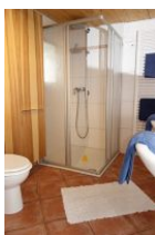
...und großer Duschkabine.