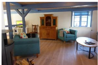
Zwei gemütliche Sessel für den Abend am Ofen ?