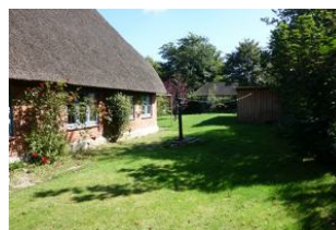
Ein Teil des Gartens