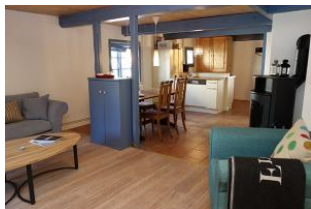
Herrlich diese offenen Räume, hier vom Wohnzimmer aus der Blick zum Essplatz und zur Küche