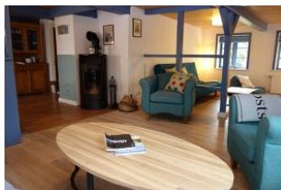
Der dänische Eisenofen