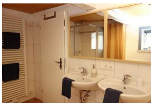
Das großzügige Bad mit Handtuchheizung und zwei Waschtischen....