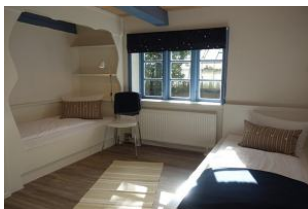
Das Kinderzimmer mit zwei Einzelbetten, wer es gern kuschelig mag, schläft im Kojenbett (normale Größe 90x200cm)