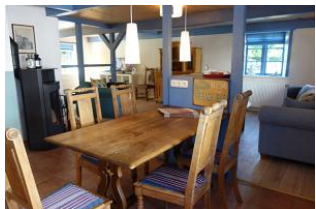
Der Essplatz, kurze Wege zur Küche