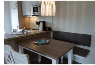
.Der Esstisch - Anschluss.....