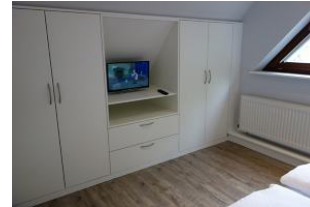
...auch hier viel Stauraum und ein kleines TV - Gerät