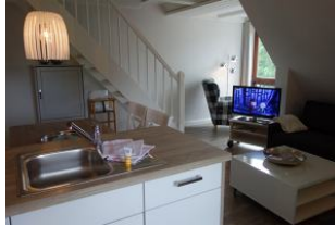
Der Blick von der Küche aus.