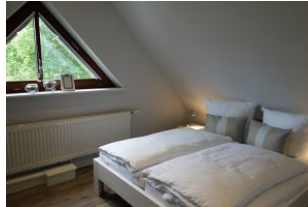
Das Schlafzimmer im Dachgeschoß...