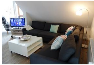
...hier finden alle Familienmitglieder ein Plätzchen