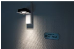
Die Wohnung 3 - Rüm Hart lädt ein .....