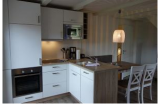
...an die Küche