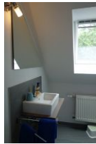
Im Dachgeschoß ein kleines Bad mit Handwaschbecken und ...