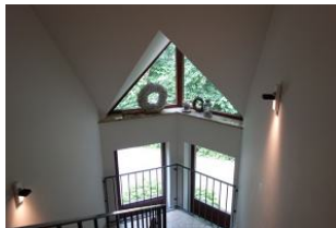
Das Treppenhaus im Haus Neshörn