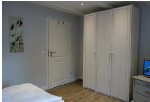
... und viel Stauraum im großen Kleiderschrank.