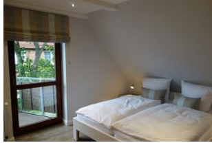
Das große Doppelbett im Schlafzimmer, Austritt auf den Balkon....