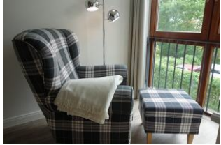
Einladend .... ein gemütliches Plätzchen