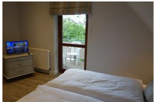
...ein kleines TV - Gerät...