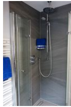
...die Duschkabine mit Echtglaswänden und Bodenablauf.