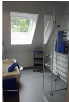
Das moderne Duschbad... (nicht im Bild: die Toilette)