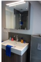
...Waschtisch und Schrank für alle kleinen und großen Badutensilien....