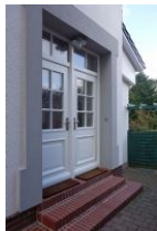
...die linke Haustür führt in die Wohnung 1

Die Villa Hansson - altes Haus in neuem Glanz. mit ganz besonderem Charme. Moderner Scandi Look in großen, hellen und hohen Räumen macht gleich gute Laune. Wohnzimmer, Esszimmer (hier stehen noch zwei Schrankbetten) Schlafzimmer, Küche, Duschbad alles hell und freundlich in weiß und hellen Holzönen eingerichtet. Großenteils konnten die alten Zimmertüren erhalten werden. Herrlich diese Mischung aus alt und neu. Das Haus ist zentral gelegen, Einkaufsmöglichkeiten beim Edeka Knudtsen direkt gegenüber.