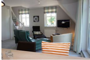
Der Blick von der Küche zur Wohncke.