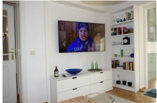
Großes TV Gerät für den gemütlichen Abend