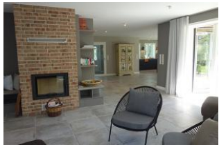
Der Blick Richtung Küche...