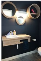
Das Gäste-WC im Erdgeschoss