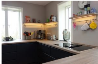
...benutzerfreundlich mit Schubladen.