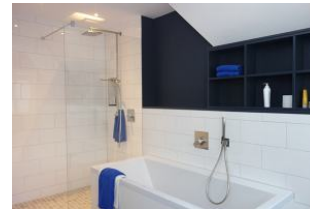
...mit Badewanne und großzügiger, bodengleicher Dusche