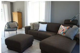
die Couchecke für lange Klönabende ....