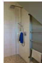
...mit großzügiger, bodengleicher Dusche