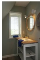
Das kleine, aber feine dazugehörige Bad, ebenfalls vom Schlafzimmer aus zu begehen