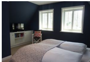
Einbaukommode und TV Gerät