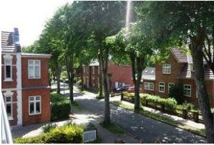
Der Blick entlang der Feldstr. zum Mühlenpark