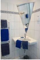
Das Waschbecker mit spezieller Spiegellösung