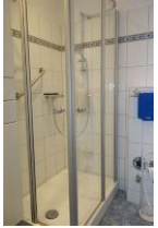
die Duschkabine mißt 90x75, niedrige Duschwanne