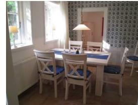
Frühstück mit Sonne - herrlich