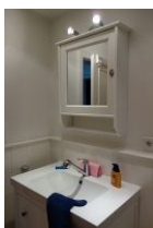
...Handwaschbecken und Spiegelschrank