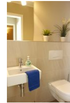
Die Toilette im Saunabereich