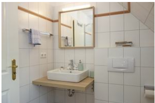
Der Waschtisch im Bad

Entfernungen, zirka: zum Bäcker 150 m, zur Einkaufsmöglichkeit 4,0 km, zum Flugplatz 4,0 km, zum Golfplatz 4,2 km, zum Hafen 4,5 km, zum ÖPNV 200 m, zum Badstrand 4,0 km, zum Ortszentrum 200 m