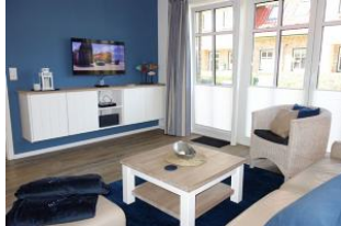
TV Gerät, rechts die große Glasfront zum Garten