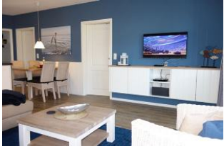
TV Gerät und Blick zum Esstisch