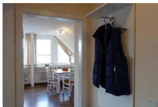
...treten Sie ein ...