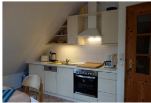
Die offene Küchenzeile