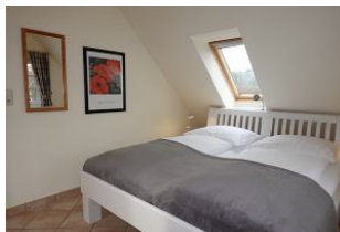
...hier noch einmal das Bett