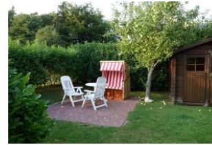
Der große Garten ist für alle Gäste zu nutzen.