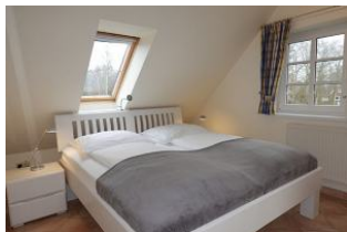
Das große Doppelbett sorgt für erholsamen Schlaf. 180x200cm