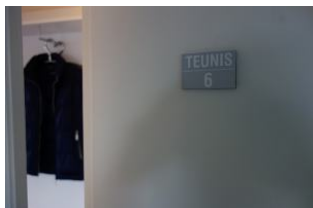
Die Wohnung 6 befindet sich im 2.OG links