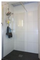
...mit großem Duschbereich.