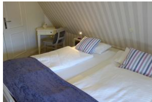
...und kleinem Schreibsekretär.