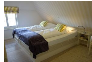
Das grüne Schlafzimmer... Bettmaß ebenfalls 200x200cm