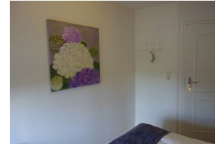
Ein Hortensienbild, ebenfalls im lila-Ton