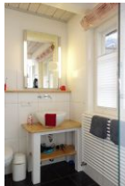
Das Bad im Erdgeschoß...