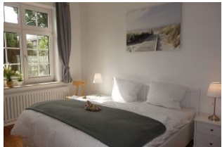
Das große Elternschlafzimmer mit Doppelbett 180x200cm ohne Fussteil