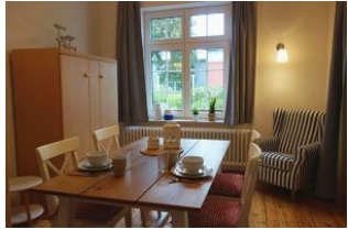
...ein sep. Esszimmer findet man selten, auch gut als Leserückzugsort geeignet...