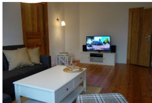
...vielleicht auch Fernseh - Abend ???