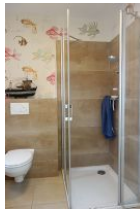
Die Dusche im Bad im Erdgeschoß