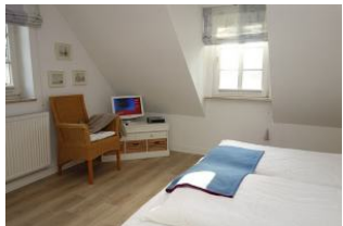
Kleines TV Gerät im Elternschlafzimmer