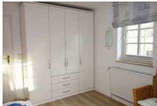
Der Schrank im Elternschlafzimmer