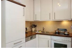
Die offene Einbauküche