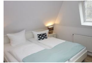
Zwei Einzelbetten im offenen Dachgeschoss (zusammen gestellt)