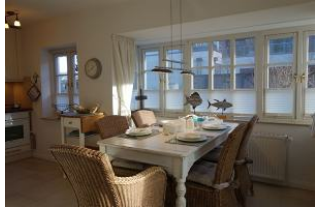
...nehmen Sie Platz, Essen kommt gleich ....