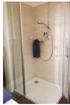
...die Dusche mit flachem Einstieg