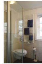
Handtuchwärmer und Toilette