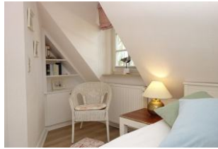
....gemütliche Leseecke im Einzel-Schlafzimmer