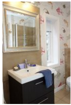
Das Duschbad im Erdgeschoß, hier das Handwaschbecken; nicht im Bild, die Toilette