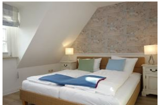
Großes Doppelbett im Elternschlafzimmer 180x200 ohne Fussteil