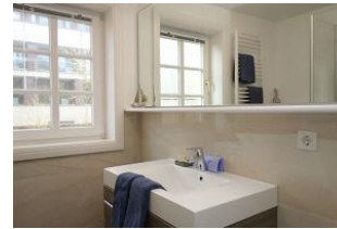
Das Duschbad im Obergeschoß