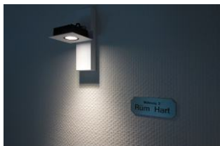
Die Wohnung 3 - Rüm Hart lädt ein .....