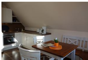
Die offene Küchenzeile