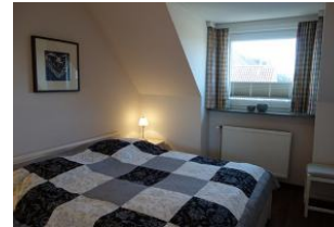
Das Schlafzimmer mit großem Doppelbett...