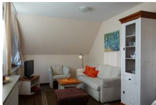
Eine gemütliche Wohncke mit TV Gerät