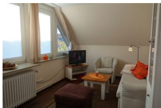
Große Fenster durchfluten den Raum mit Sonne