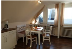
Der Essplatz an der offenen Küche