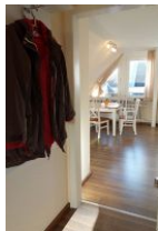
Der kleine Flur mit Garderobe