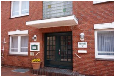
Das Haus Teunis in der Mühlenstr. 9 / Ecke Carl-Häberlin-Str. in Wyk