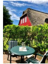
...Tisch und Stühlen.