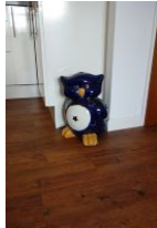
...die Namensgeberin der Wohnung: die Eule

Klein - aber mein, könnte man zum Eulennest sagen. Diese geschmackvoll eingerichtete Wohnung - im Herbst 2013 komplett renoviert und neu eingerichtet - bietet zwei Personen Platz für einen erholsamen Urlaub. Das Wohnzimmer mit offener Küchenzeile, Austritt auf die Terrasse, das sep. Schlafzimmer, das Wannabad mit Duschabtrennung bieten genügend Raum. Mitten in der Stadt, unweit des Storchensparks und nur wenige Gehminuten zum Strand, eine komfortable Wohnung zu ebener Erde - was braucht es noch zur guten Erholung ?