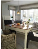
...der kleine Essplatz.....