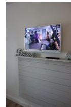
...Flachbild - TV - Gerät