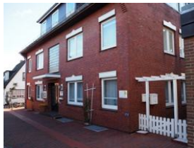
Ansicht Haus Teunis Mühlenstr.