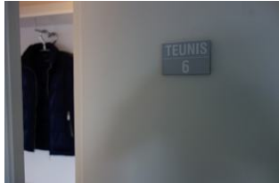
Die Wohnung 6 befindet sich im 2.OG links