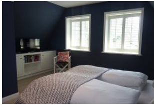
Einbaukommode und TV Gerät