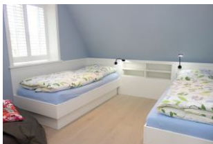
Zwei Einzelbetten (je 90x200cm) im Kinderzimmer