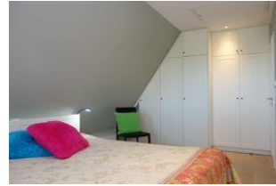
...und großem Einbauschrack.