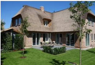
Die herrliche Terrasse. Hier dürfen Sie den Tag beginnen.....