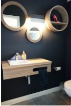
Das Gäste-WC im Erdgeschoss