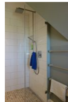
...mit großzügiger, bodengleicher Dusche