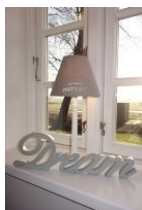
I had a dream.....