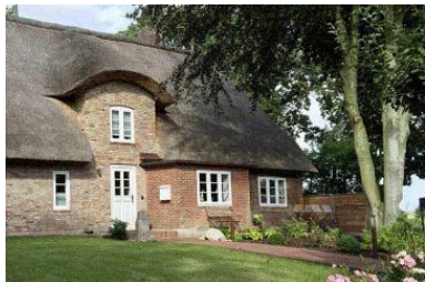
Das Haus WattGut in Oevenum

Die Unterkunft verteilt sich über EG und 1.OG.