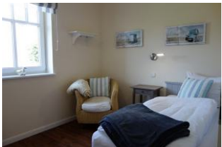
Ein Schlafzimmer im Erdgeschoß mit Einzelbett, Kleiderschrank. Nicht im Bild, das TV - Gerät.