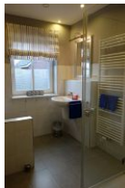
Das Duschbad im EG, hier befindet sich auch die Waschmaschine, die Ihnen kostenfrei zur Verfügung steht.