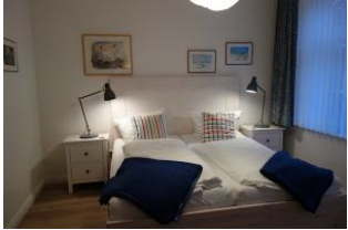
Das Schlafzimmer ist vom Wohnzimmer aus zu begehren, Doppelbett 180x200cm