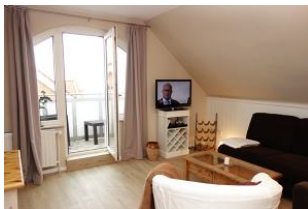
...und Austritt auf den Balkon....