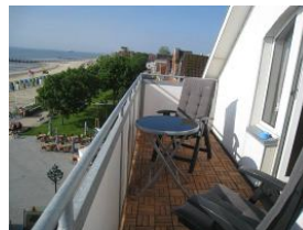
... über den Dächern von Wyk....