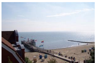
Der traumhafte Blick auf die Mittelbrücke

"über den Dächern von Wyk..." so fühlt man sich in diesem fast 100 Jahre alten Stadthaus. Genießen Sie bei einer guten Tasse Tee diese traumhafte Aussicht auf das Meer, die Mittelbrücke und nicht zuletzt das bunte Treiben auf der Promenade, dem Sandwall. Die modern eingerichtete Wohnung mit dem Charme alter Gemäuer versetzt einen zurück in die "gute, alte Zeit". Teppichböden gibt es keine mehr. Mittendrin wohnen, den Blick genießen, die Kurmusik aus der Ferne hören - Erholung pur.... Unser Tipp: vergessen Sie das Fernglas nicht! Aber Vorsicht: in diesem Haus sind die Treppen lang, steil und die einz. Stufen kurz. Allein zur 1.Etage sind es schon 17 Stufen.