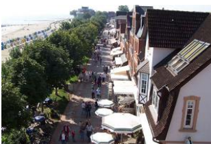
....und auf den Sandwall