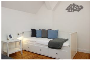
Das Kinderzimmer mit einem Einzelbett...

Entfernungen, zirka: zum Bäcker 50 m, zur Einkaufsmöglichkeit 50 m, zum Flugplatz 3,0 km, zum Golfplatz 3,2 km, zum Hafen 500 m, zum ÖPNV 70 m, zum Badestrand 350 m, zum Ortszentrum 100 m