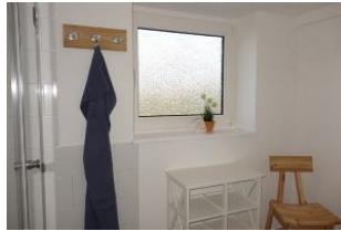
...großem Fenster ..