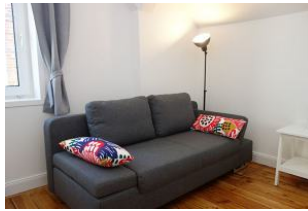
...und zus. Schlafcouch.