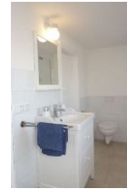
...Waschbecken und Toilette